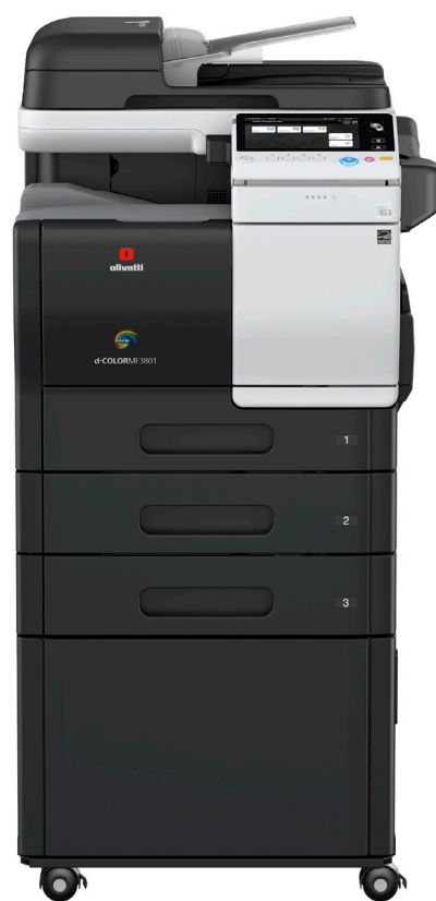
Configuration avec 2 magasins papier optionnels et meuble support