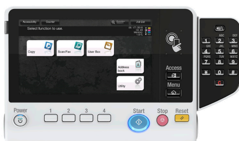
Ecran tactile couleur 7" Multi-touch avec zone d'authentification NFC et clavier (KP-101) optionnel