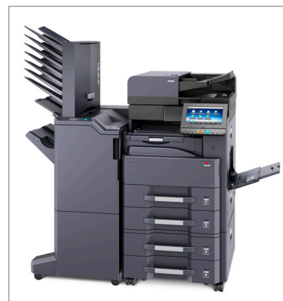
d-Copia 3201MF (ou d-Copia 4001MF) + DP-7110 + PF-791 + DF-7110 + AK-740 + MT-730(B)