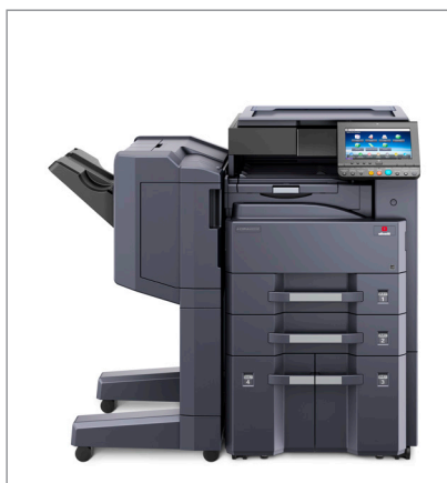
d-Copia 3201MF (ou d-Copia 4001MF) + Couvre original + PF-810 + DF-7120 + AK-740